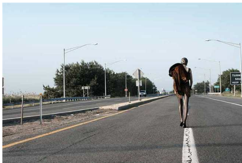
Fitwalking - Vogue Italia, Agosto 2006

Lo sport più praticato? Il Fitwalking. Camminare infatti è una passione trasversale, amata da donne e uomini di tutte le età, e ha ormai superato corsa e iscrizioni in