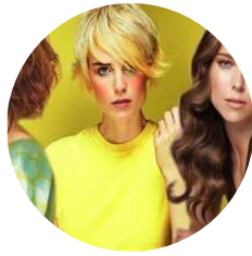
I tagli della primavera-estate