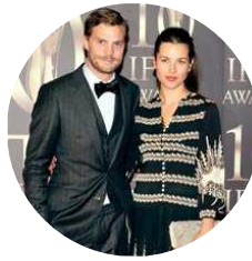
Jamie, addio a Mr Grey?