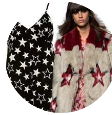
Fan di Stelle