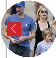
We are family